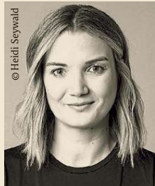
Host: Magdalena Pötsch DER STANDARD